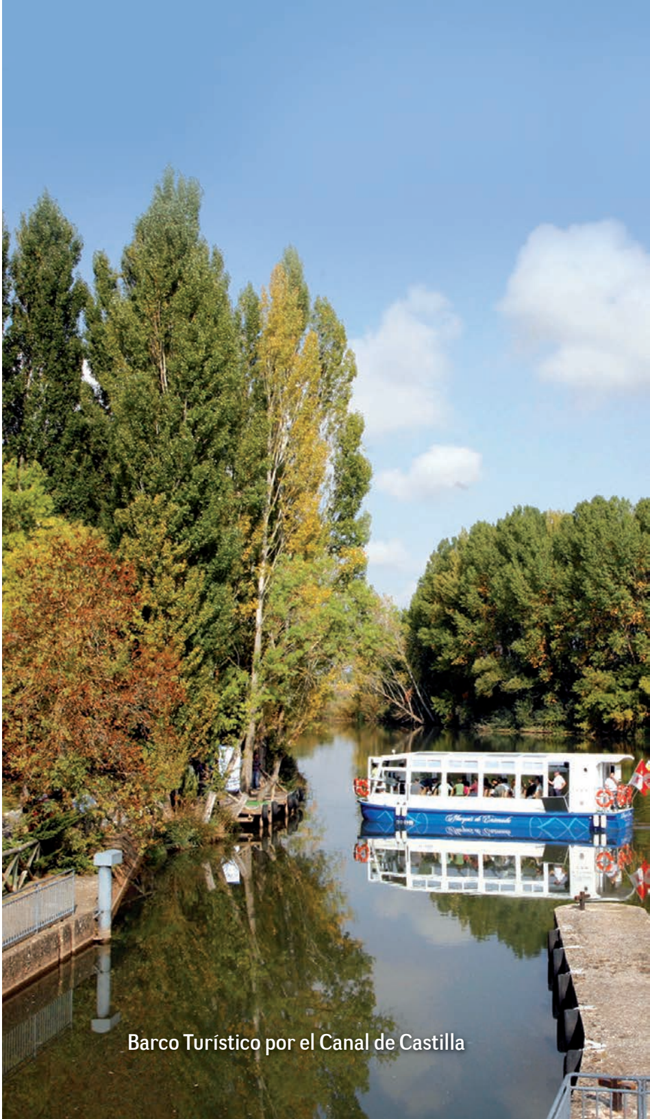
Barco Turístico por el Canal de Castilla