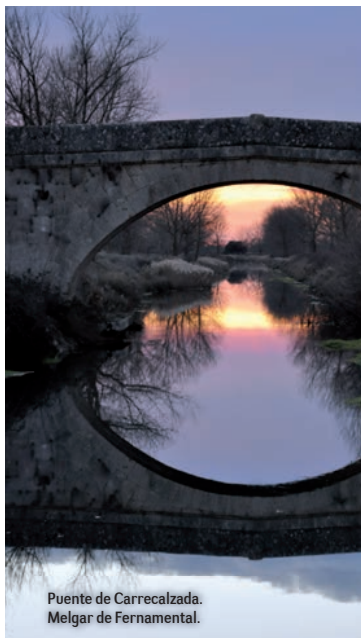
Puente de Carrecalzada. Melgar de Fernamental.

ahorro de coste en su construcción y un llenado más rápido, aunque solamente permiten el paso de una barcaza. Corresponden al siglo XIX y en total son 15 esclusas, cuyas dimensiones son de 30 metros de largo por 5 metros de ancho.