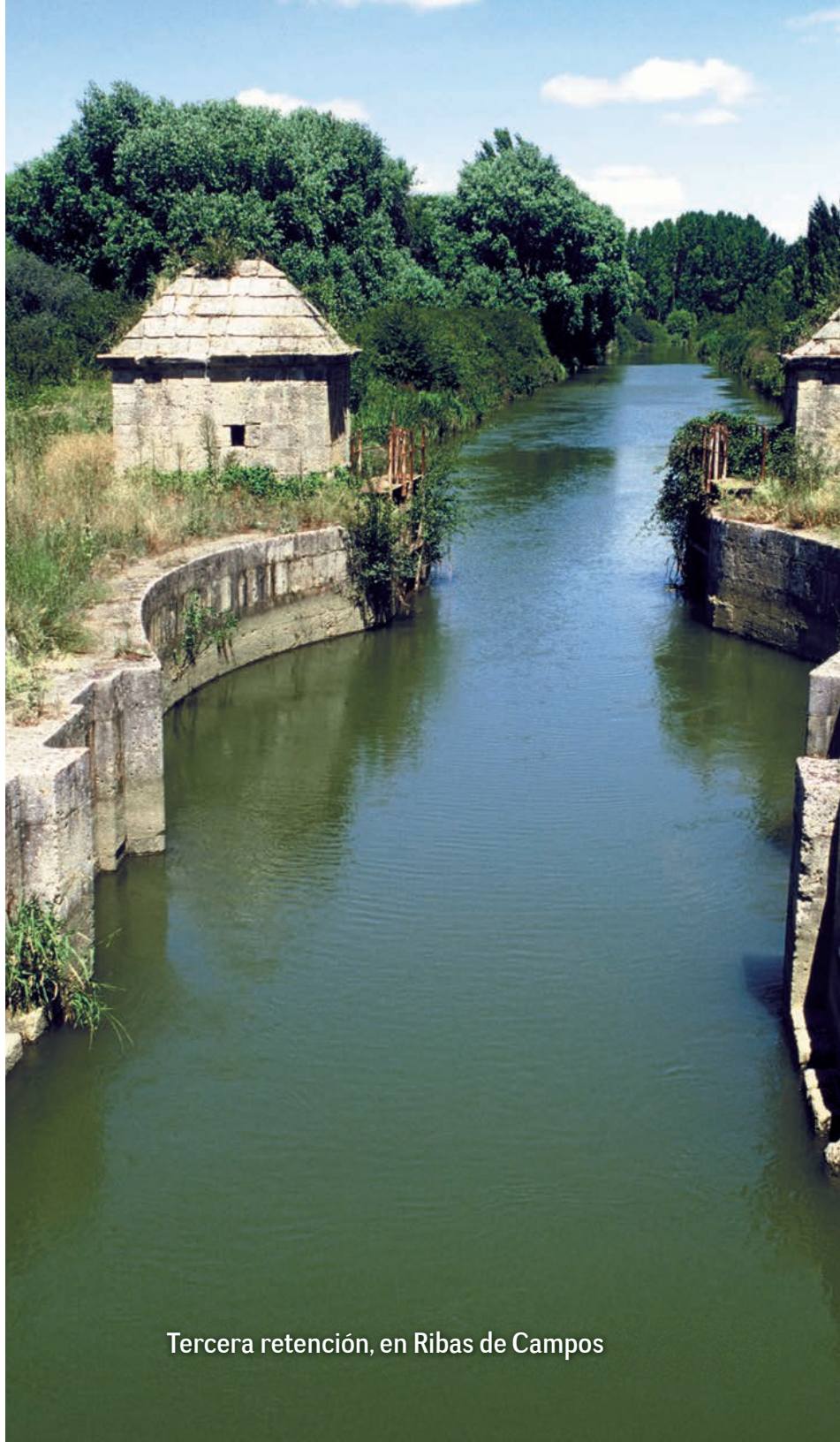
Tercera retención, en Ribas de Campos