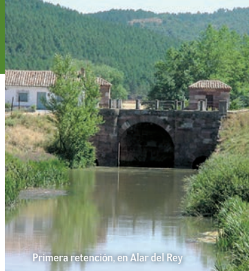
Primera retención, en Alar de Rey

Rectangulares: Corresponden a la etapa en que se privatiza la construcción del Canal. Suponen un