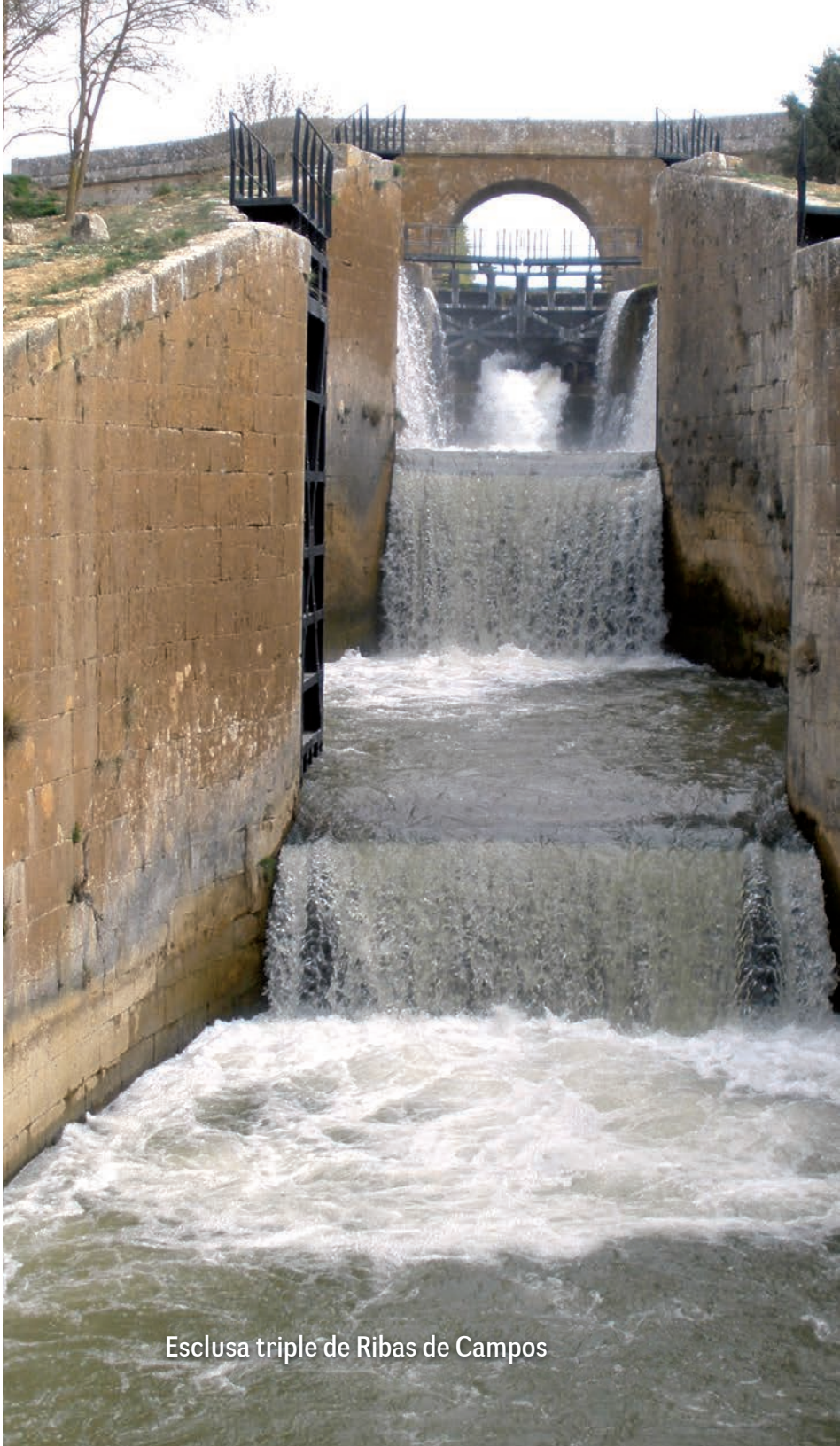
Esclusa triple de Ribas de Campos